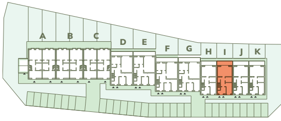
Wspólna 25-45, Kruszwica