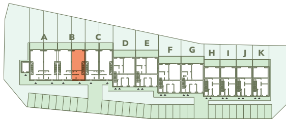
Wspólna 25-45, Kruszwica